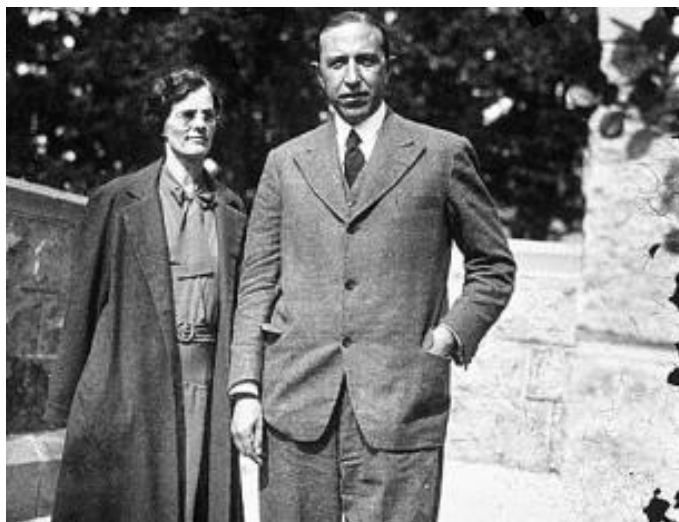
PEDRO SALINAS Y SU ESPOSA, MARGARITA BONMATÍ, YA EN EL EXILIO.

Esta trascendentalización de lo corporal -Salinas trascendentaliza todo lo que toca- permite que la salvación se produzca por el cuerpo, a través de él, porque sus cuerpos son cuerpos más allá del cuerpo, cuerpos en simbiosis total con sus almas, “transcuerpos”, mera forma de la esencia.